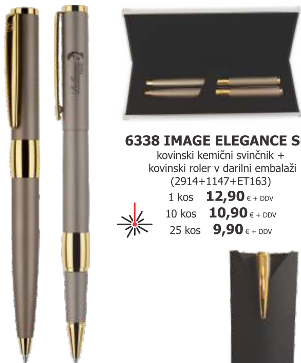
6338 IMAGE ELEGANCE SET kovinski kemični svinčnik + kovinski roler v darilni embalaži (2914+1147+ET163) 1 kos 12,90 € + DDV 10 kos 10,90 € + DDV 25 kos 9,90 € + DDV

laserska gravura enega motiva samo 5 € + ddv za celotno naročilo izdelkov na tej strani