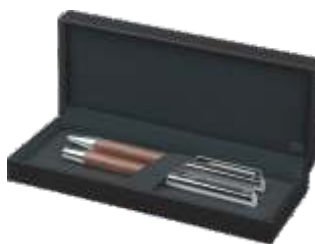
6253 SET TIZIO Roller in kemični svinčnik tikov les/jeklo, darilna embalaža v videzu usnja (2400+1240+ET160) 30,99 € + DDV

laserska gravura enega motiva samo 5 € + ddv za celotno naročilo izdelkov na tej strani