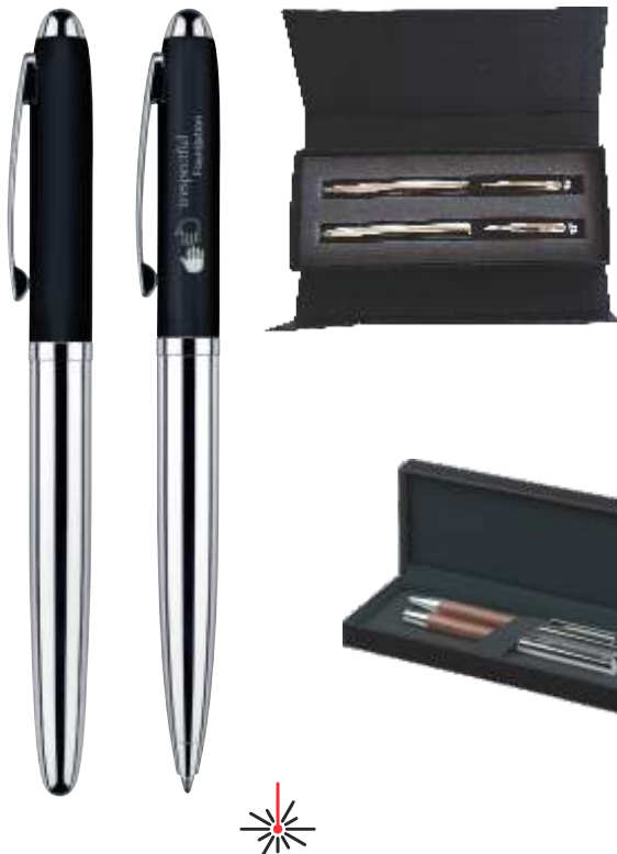
6297 SET NAUTIC Roller in kemični svinčnik darilna embalaža z magnetnim zapiralom (2215+1092+ET156) 14,82 € + DDV