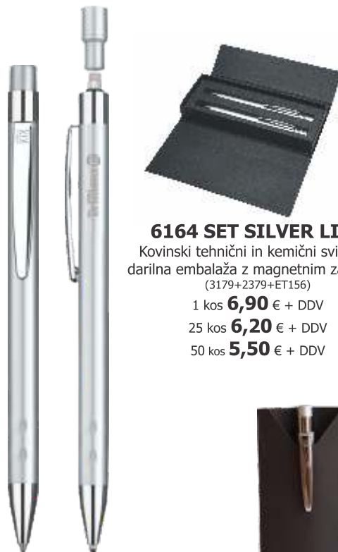
6164 SET SILVER LINE Kovinski tehnični in kemični svinčnik, darilna embalaža z magnetnim zapiralom (3179+2379+ET156) 1 kos 6,90 € + DDV 25 kos 6,20 € + DDV 50 kos 5,50 € + DDV