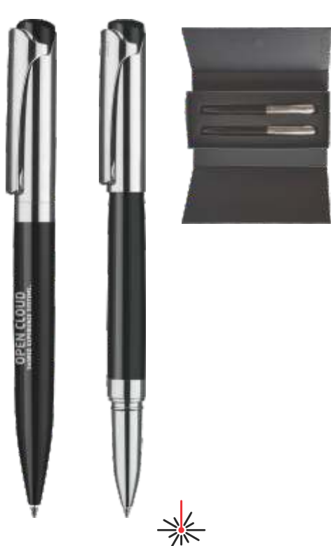
6299 SET VISIR Roller in kemični svinčnik darilna embalaža z magnetnim zapiralom (2253+1056+ET156) 14,02 € + DDV